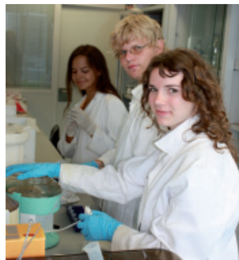
Die Laborarbeit umfasst verschiedene Schritte, die meisten sind völlig unspektakulär.

Was wäre, wenn man anstatt zu kuzen die gewünschten Gene aus der Wildaubergine direkt in die Kulturpflanze gezielt übertragen könnte? Wie auch immer sich die Methoden weiterentwickeln, ein moderner Landwirt muss sich auf jeden Fall mit der neuen Technologie auseinandersetzen, die Schule in Ursprung ist in dieser Hinsicht bestens aufgestellt.